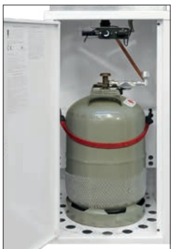
Einsicht in geöffneten Sockel mit angeschlossener Gasflasche

Großzügige Panorama-Rundumsicht auf das Flammenspiel